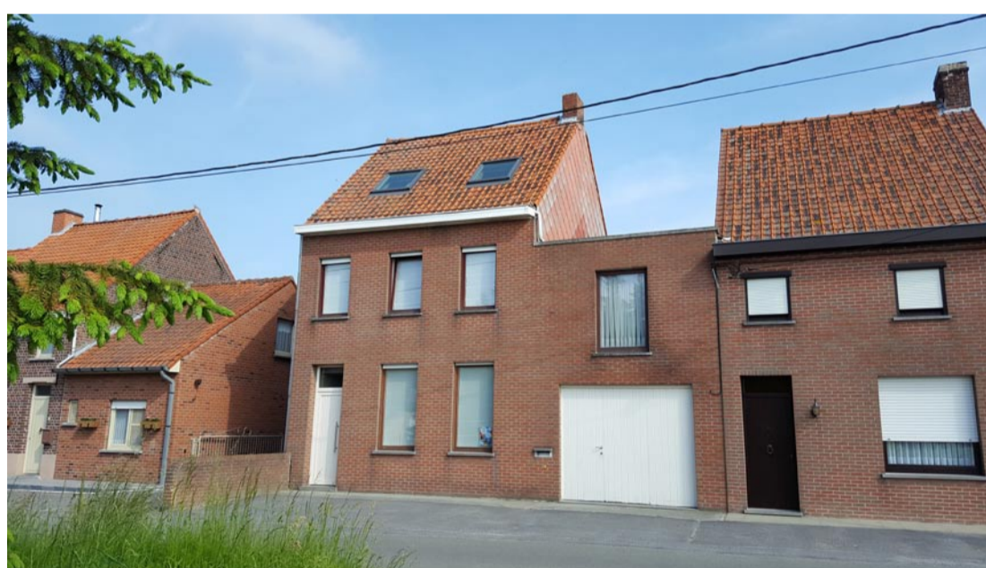
Situatie anno 2017